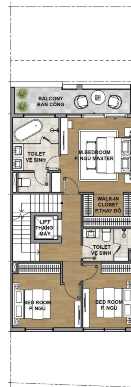
3 3RD FLOOR PLAN MẶT BẰNG TẦNG 3