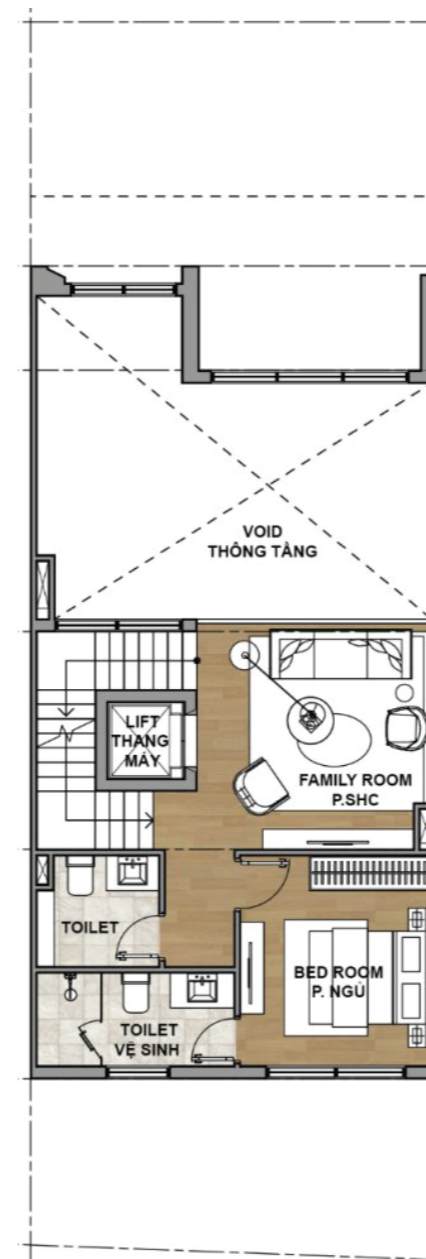
2 2ND FLOOR PLAN MẶT BẰNG TẦNG 2