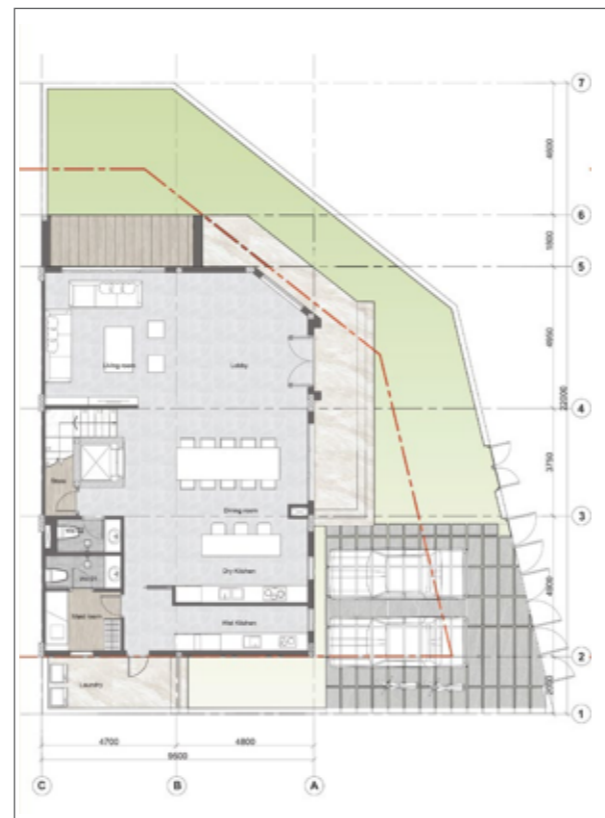
1 1 ST FLOOR PLAN MẶT BỀNG TẦNG 1

Ghi chú: Diện tích sau cùng sẽ được xác định bởi đơn vị đo đạc