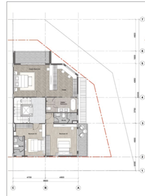
3 3 RD FLOOR PLAN MẶT BỀNG TẦNG 3