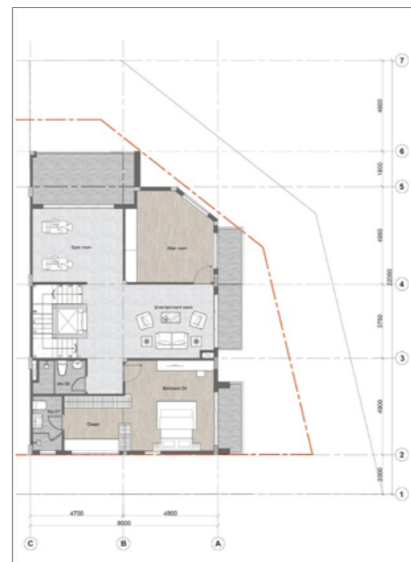
4 4 TH FLOOR PLAN MẶT BỀNG TẦNG 4