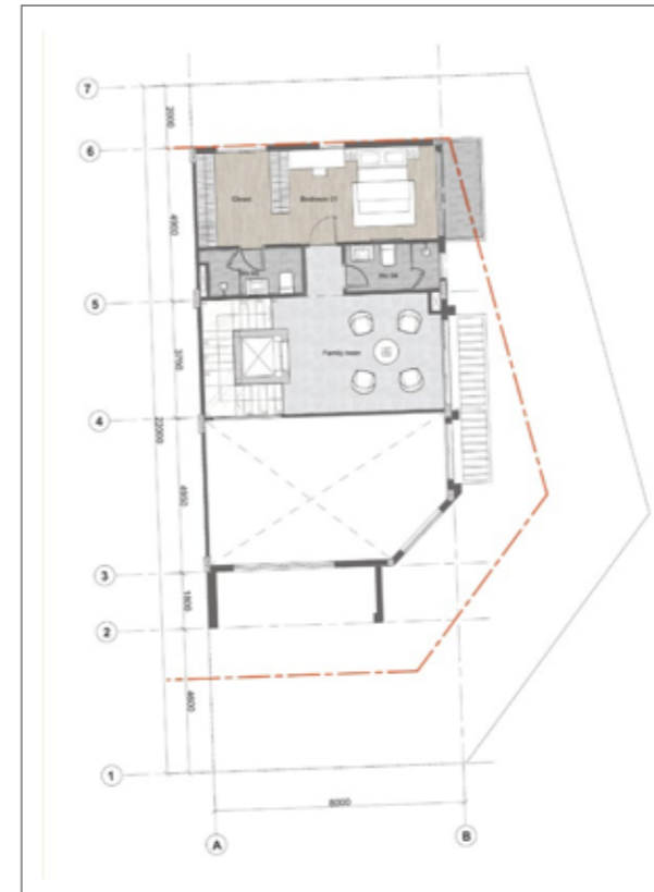
2 2 ND FLOOR PLAN MẶT BẰNG TẦNG 2