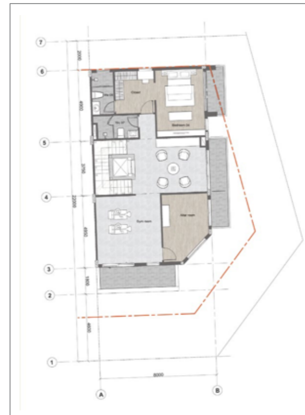
4 4 TH FLOOR PLAN MẶT BẰNG TẦNG 4