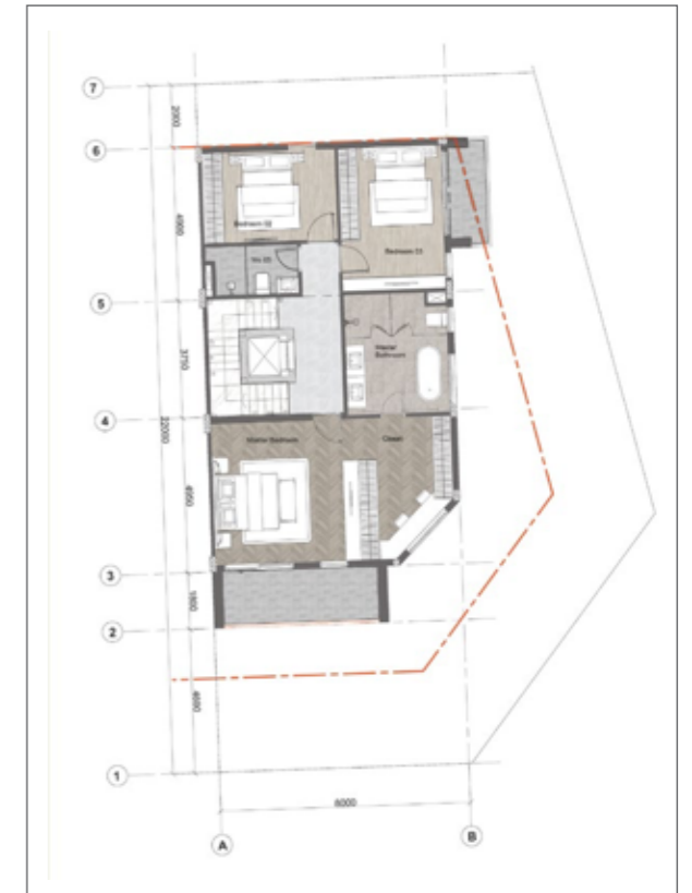
3 3 RD FLOOR PLAN MẶT BẰNG TẦNG 3